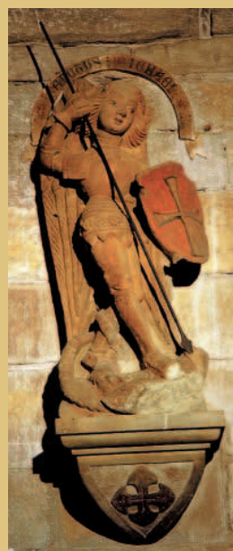
San Miguel Escultura en piedra policromada. Primera mitad del siglo XV. Iglesia parroquial de Zaidín

→ no se ajusta a derecho: todas las diócesis del mundo han sacado bienes de las parroquias ¡faltaría más!