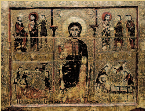
Frontal de Tresserra Pintura al temple sobre madera con relieves de estuco y cubierta de estaño con forro. Siglo XIII. Iglesia parroquial de Tresserra