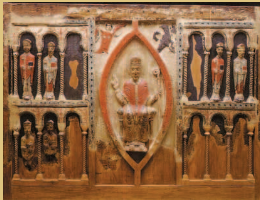
Frontal de san Hilario Taller ribagorzano. Talla de madera aplicada y policromada. Primera mitad del siglo XIII. Iglesia parroquial de Buirá