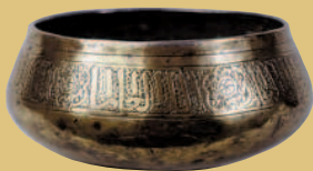
Bol Estaño fundido, sobre codiciado, martilleado, cincelado y burilado. Primera mitad del siglo XIV. Iglesia parroquial de Benavente de Ribagorça (?)

La historiadora explica que el valor de las obras no es individual: "Lo importante es que hablamos de un conjunto perteneciente a una zona concreta en un periodo determinado -la diócesis de Lleida a partir de la conquista cristiana-, y es la suma de todas las piezas, por humildes que sean, lo que permite una visión historiográfica y artística"