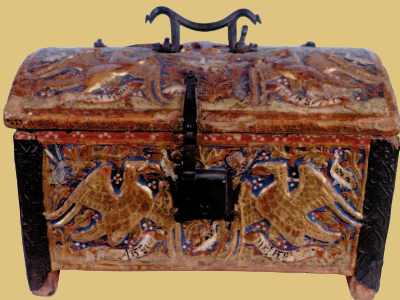
Arqueta Madera decorada con relieves de estuco dorados, picados y policromados. Primer tercio siglo XIV. Iglesia parroquial de Buirá