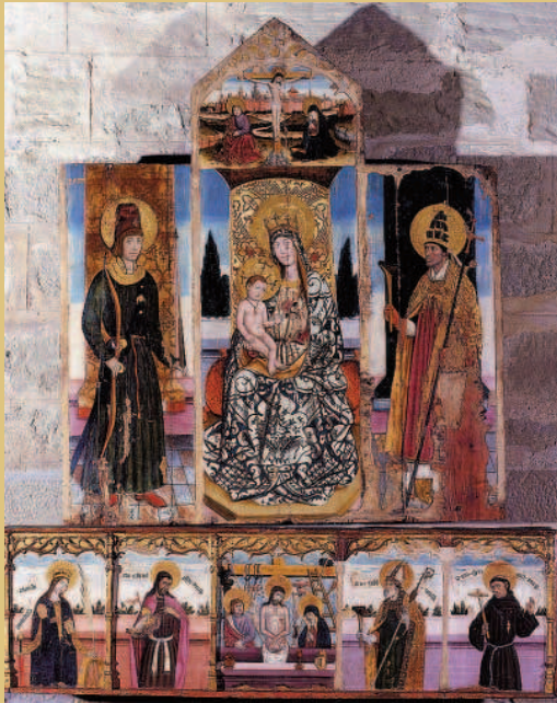
Retablo de s. Antonio abad y s. Pablo ermitaño Jaume Ferrer I. Pintura al temple sobre madera de pino y dorados. Primera mitad del siglo XV. Iglesia parroquial de Monzón (Huesca). Antes en la Seu Vella de Lleida